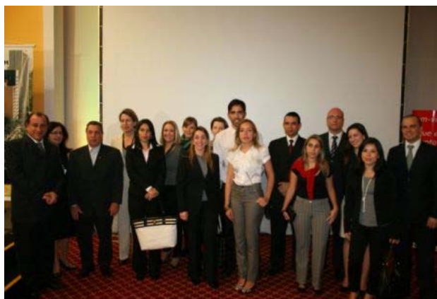
Parceiros que trabalharam no projeto