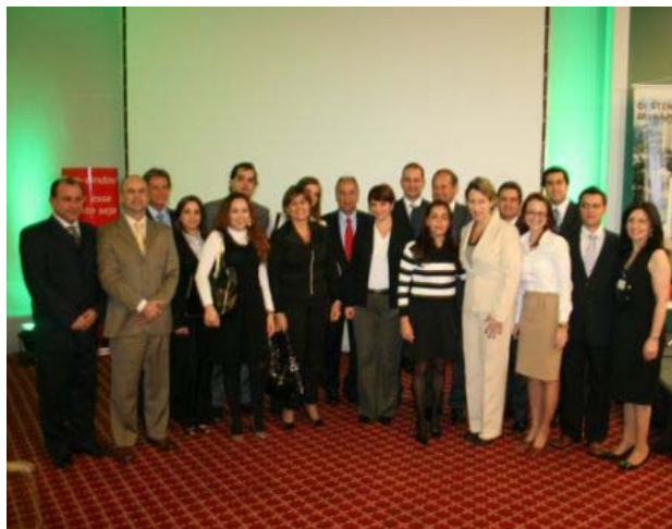
Equipes SPCVB e...

www.visitesaopaulo.com/farialimitaim www.visitesaopaulo.com/ibirapueramoema