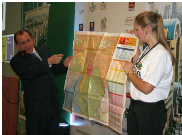
O diretor superintendente do SPCVB mostra aos convidados o mapa da capital paulista

O projeto, que já trouxe os destinos Berrini , Paulista & Jardins e Centro , Anhembi & Center Norte , visa a unificar a cidade paulistana num banco de dados que possa facilitar a captação de eventos e ampliar a demanda de turistas no município.